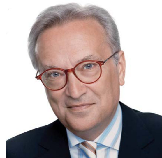
Hannes Swoboda Presidente del Grupo S&D

“ Hemos luchado contra la discriminación y promovido la igualdad de derechos y oportunidades, especialmente de las mujeres y los niños, así como a la cooperación y apoyo a los sindicatos y a otras organizaciones de la sociedad civil. ”