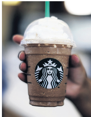
Starbucks, koffie met een luchtje.

EU-lidstaten blijven elkaar beconcurreren door het aanbieden van allerlei belastingvoordelen, vastgelegd in 'tax rulings' (geheime afspraken tussen belastingdiensten en grote be-