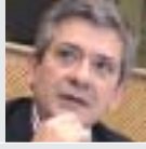
Enrique Barón Crespo