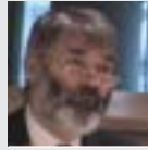
Proinsias De Rossa